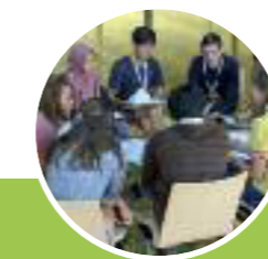
The SUSTREE project ends with a final project dissemination event in Brussels, Belgium, in 2019.