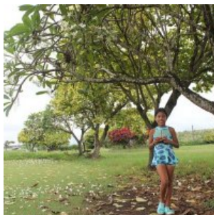
Děti píšou o přírodě: Představení projektu aneb jak to všechno začalo