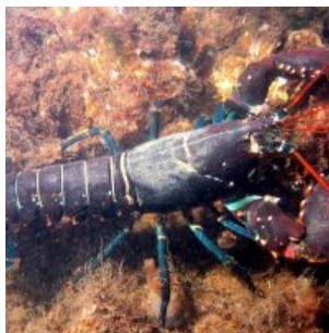
Rybář chytil extrémně vzácného „duhového“ humra