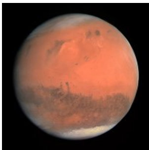
Na Marsu byl objeven biologický materiál. Znamená to život?